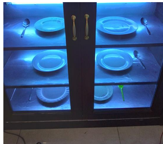
Sterilisasi Alat Makan