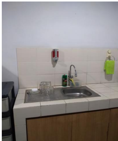
Keadaan Dapur di PT Venamon