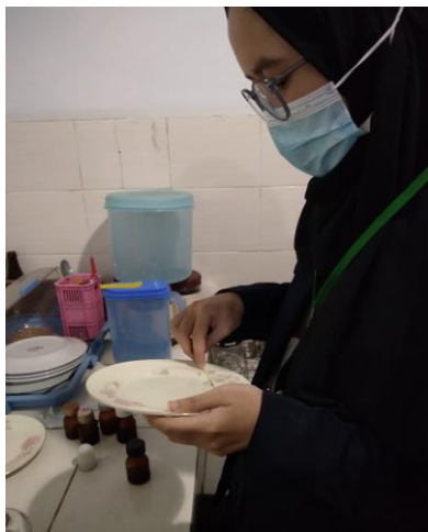
Pengambilan Sampel Usap Alat Makan