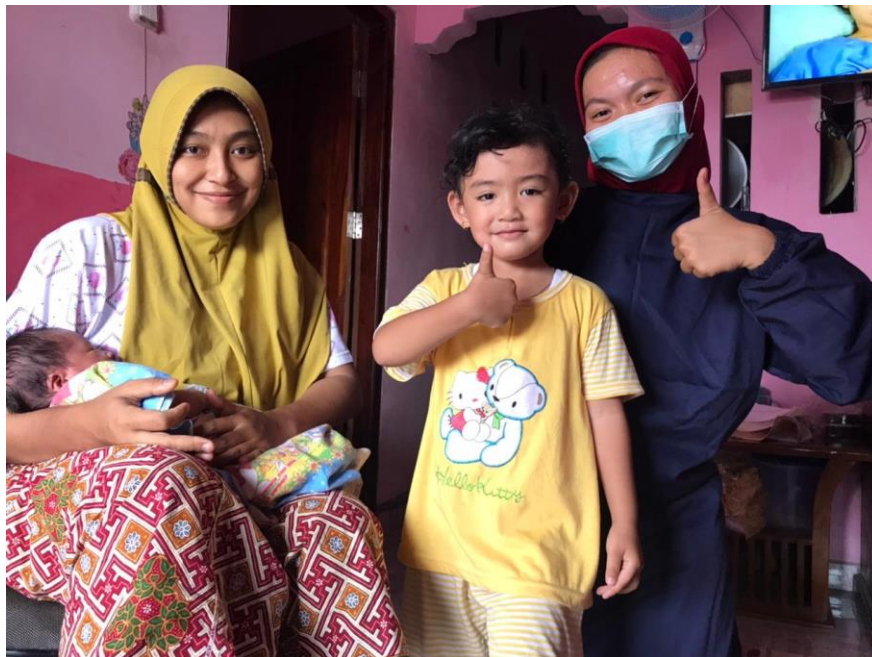
Lampiran 4 Dokumentasi Kunjungan