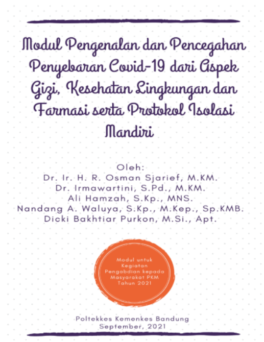
Gambar 3. Sampul dengan judul “Modul Pengenalan dan Pencegahan Penyebaran Covid-19 dari Aspek Gizi, Kesehatan Lingkungan, dan Farmasi, serta Implementasi Protokol Isolasi Mandiri”

Salah satu edukasi kesehatan yang diberikan yaitu tentang implementasi protokol kesehatan dan isolasi mandiri dalam pandemi Covid-19 . Sehingga supaya lebih sistematis dalam penyampaian materi ini, maka diberikan terlebih dahulu materi mengenai pengenalan dan pencegahan Covid-19 dari aspek pola hidup bersih dan sehat (PHBS) dan kepatuhan menjaga jarak untuk meminimalisir/mencegah penyebaran Covid-19 (I. P. Dewi, 2021). Kebiasaan pola hidup bersih dan sehat perlu diterapkan terutama mengenai kebiasaan mencuci tangan, menggunakan hand sanitizer saat bepergian, dan menggunakan APD. Komitmen terkait kepatuhan dalam menjaga jarak dalam masa pandemi Covid-19 ini juga diperlukan sebagai upaya pencegahan penyebaran Covid-19 sesuai anjuran Pemerintah Republik Indonesia. Pemahaman mengenai hal ini mengalami peningkatan seperti yang terlihat pada evaluasi data pre-test dan post-test di Tabel 3. Pengimplementasian