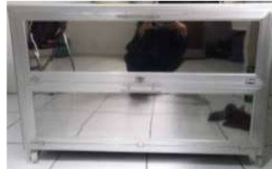
Gambar 2. Alat Lemari Sterilisasi Alat Makan

Alat ini dibuat dari bahan stainles steel dengan dimensi panjang 100 cm x 45 cm x 50 cm. Agar lemari steril mampu menampung seluruh alat makan yang ada, dan untuk menghindari biasanya sifat penyinaran Ultraviolet – C maka lemari steril dibuat bertingkat dengan 2 tingkatan rak. Pada setiap tingkatannya terdapat 1 lampu Ultraviolet – C dengan ketinggian 10 cm dan variasi lama paparan 10 menit, 15 menit, dan 20 menit. . Lampu Ultraviolet – C dipasang secara portable dengan menggunakan control panel tombol dengan kerja ketika pintu dibuka maka lampu akan mati dengan sendirinya, dan ketika pintu ditutup kembali maka lampu Ultraviolet – C akan menyala kembali. Lamanya paparan sinar Ultraviolet – C dapat diatur menggunakan timer yang dapat menyalakan dan mematikan sinar tersebut.