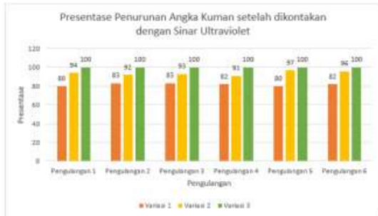
Gambar 4. Presentase Penurunan Angka Kuman pada Alat Makan