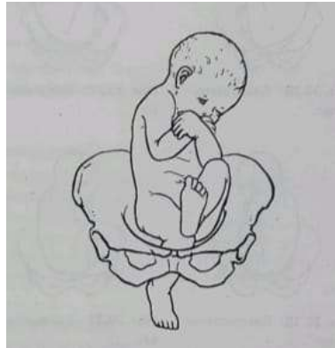
Gambar 2.3 Bokong footling ( footling breech )

Hal ini jarang terjadi. Satu atau kedua kaki menjadi bagian presentasi karena baik pinggul atau lutut tidak sepenuhnya fleksi. Kaki lebih rendah dari bokong, yang membedakannya dari presentasi bokong sempurna.