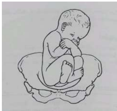
Gambar 2.2 Bokong sempurna ( complete breech )

Sikap janin pada posisi ini fleksi sempurna, dengan pinggul dan lutut fleksi dan kaki terlipat ke dalam di samping bokong.