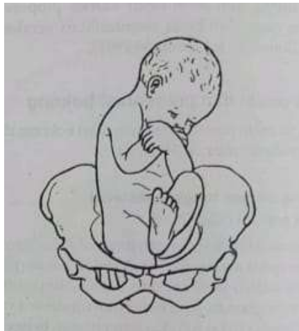
Gambar 2.4 Presentasi lutut

Hal ini jarang terjadi. Satu atau kedua pinggul mengalami ekstensi, dengan lutut fleksi. (20)